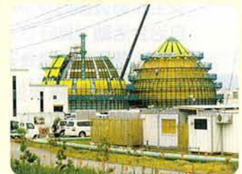
アクアバル千曲 消化タンク工事