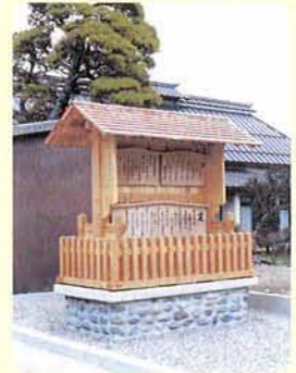
丹波嶋宿開設400年祭記念事業 高札場復元