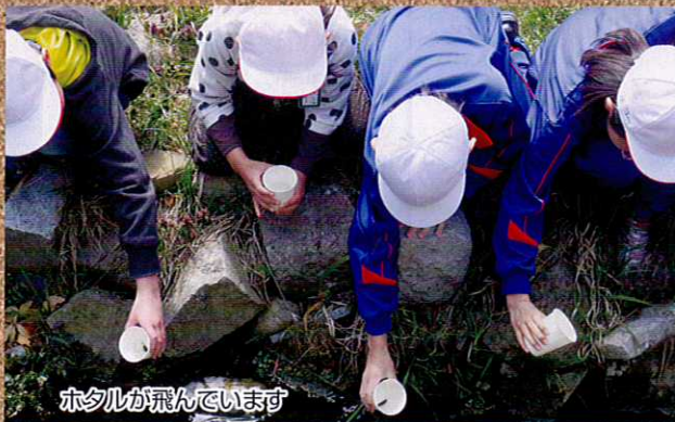
ホタルが飛んでいます