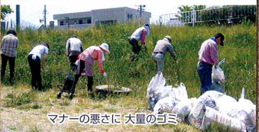
マナーの悪さに大量のゴミ