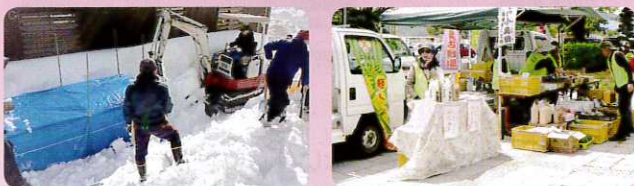
雪中りんご保存・販売

活性化委員会ましまのメンバーで、1月30日に戸隠キャンプ場事務所の北側の軒下にシナノゴールド・サンふじ合わせで96箱を雪に埋めました。今年は暖冬で雪が少なく、バックホーが大活躍でした。また、雪解けも早く、3月29日に掘り出しとなり、三太刀まつりで販売しました。