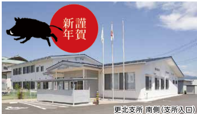
更北支所 南側(支所入口)